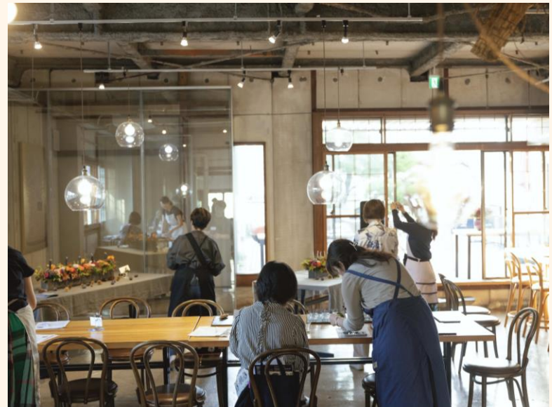
PIVEREDIERE JAPON校 教室