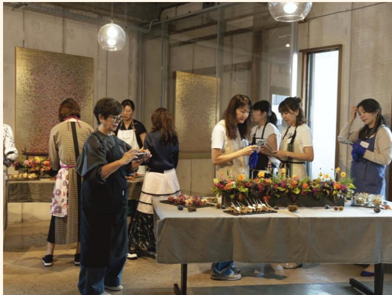
PIVEREDIERE JAPON校 教室