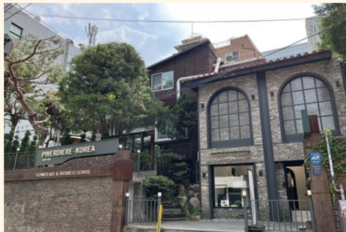
PIVEREDIERE KORIA校 ソウル校舎